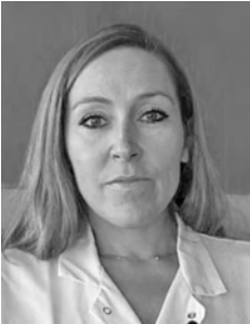
Pr Emmanuelle FERRERO Hôpital Européen Georges-Pompidou

Développer des stratégies thérapeutiques pour limiter le mal de dos