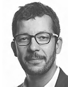
Pr Karim WAHBI Hôpital Cochin

Les cardiomyopathies (hypertrophiques ou dilatées) sont des maladies du muscle cardiaque, le plus souvent d'origine génétique, souvent familiales, assez fréquentes. La cardiomyopathie hypertrophique touche 1/500 adultes et c'est la principale cause de transplantation cardiaque chez le jeune enfant.